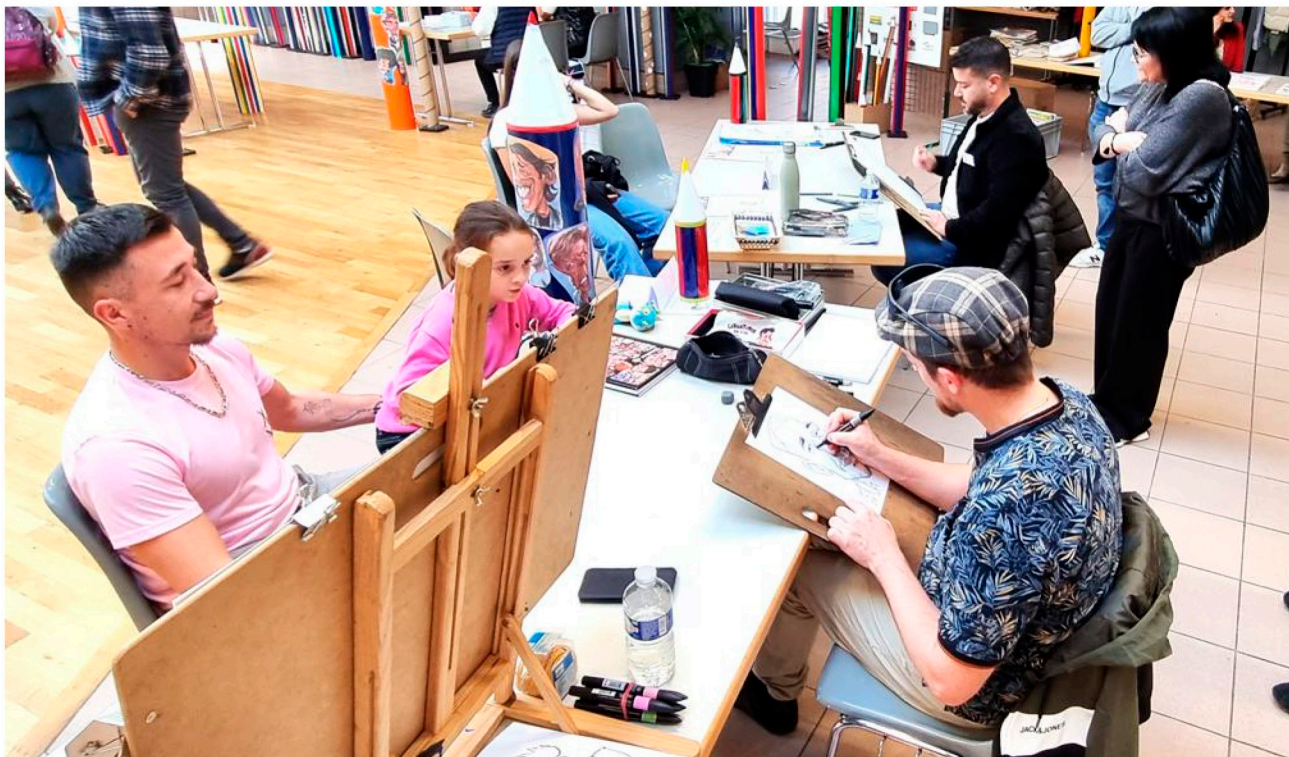
Le 8 e Festival de la caricature se poursuit ce dimanche à Paray-le-Monial. Onze dessinateurs croquent les volontaires, qui font preuve d'une belle dose d'autodérision et qui savent rire d'eux-mêmes. Page 10