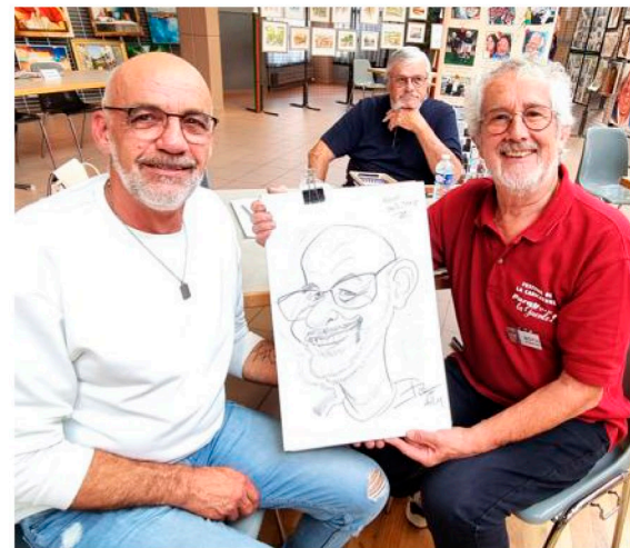
Filip s'est fait croquer par notre ami Roth.