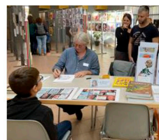
Le caricaturiste et le modèle se concentrent.