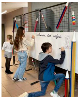
Une fresque pour la créativité des enfants, futurs talents.